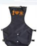
フォーター(犬用)タイプ