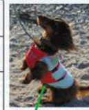
防水・透湿・高機能素材を使用、防水・透湿の性能を向上させるため、反射フィルムを使用。防水性が高い。透湿効果はトップクラスで30%前後が得意です。軽量化、耐水・耐汚れ性能に優れています。