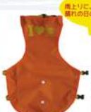
オレンジ(犬用)タイプ