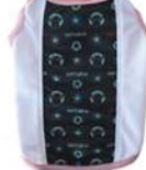
ハイブリッド・ハイパークールP2