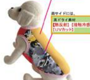
ハイブリッド・ハイパークールP2