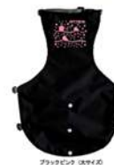
ブラックピンク (犬用)タイプ