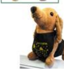
ブラックエプロン (犬用)タイプ