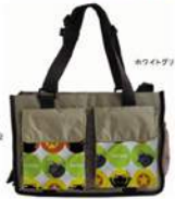
ペーパーデザイン