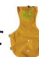
イエロー (犬用)タイプ

防水透湿加工のスクウェア素材だから、しかも汚れも水もハジキメレない。ピカイチな防水・透湿性能が得意です！