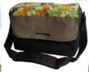
ペーパーデザイン