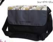
シムルデーベルト

「旅行のたこのバッグは、賢者が選んでしまおう。」「オビタンで少ししっかりしたショルダーがあったらいいのに。」 たくさんのご意見がまとまられた軽くて・シッカリとしたキャリーバッグです。